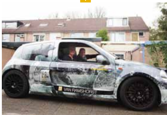
Klaar voor de reis.